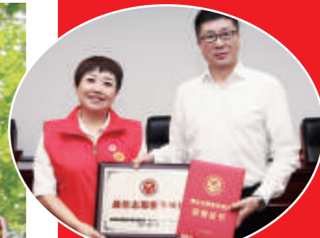
▲陕西省委常委,省委宣传部部长牛一兵为市红会党组书记、常务副会长崔锦秀颁奖