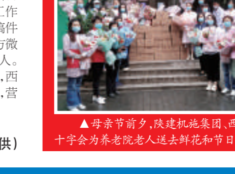
▲母亲节前夕,陕建机施集团、西安市红十字会为养老院老人送去鲜花和节日问候