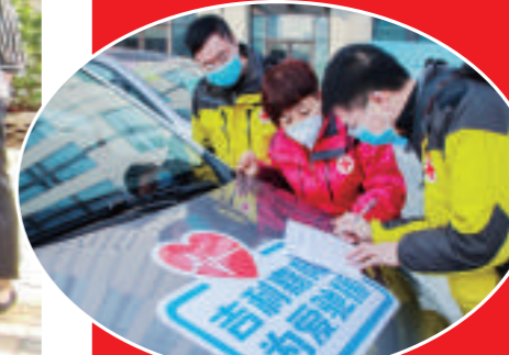
▲吉利汽车携手李书福公益基金会通过西安市红十字会向西安市疫情防控指挥部捐赠14辆吉利嘉际汽车,价值169.22万元