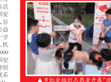
▲市红会组织志愿者开展“迎十四运 创文明城 奔跑的红十字‘救’在你身边 急救知识万人学”活动