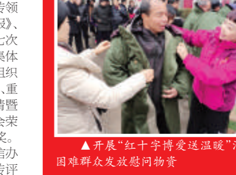
▲开展“红十字博爱送温暖”活动,为困难群众发放慰问物资