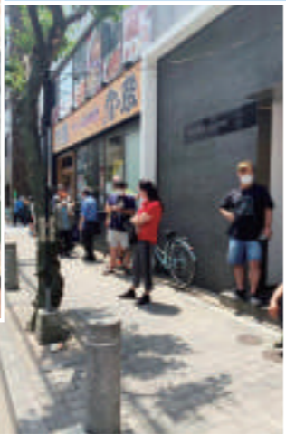
日本民众排队领取免费便当的队伍延伸至街角