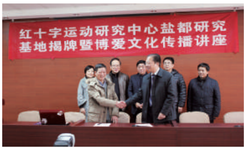
▲盐都红会与红十字运动研究中心建立稳固联系