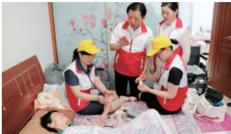
▲盐都红会结对养老、常态护理工作成为品牌

盐都,江淮平原、黄海之滨的一颗璀璨明珠,自古民风淳朴,人文底蕴深厚,济世助人的博爱文化源远流长。早在1915年,盐都区就成立了红十字组织,时称仁济堂,广泛开展伤兵救护和赈灾恤难等工作,1987年改组新建,2005年在全市首家理顺管理体制成为“区政府领导联系的独立团体”,事业步入快速发展轨道。长期以来,盐城市盐都区委、区政府高度重视、关心、支持红十字工作,盐都区红十字会在区委、区政府坚强领导和上级红十字会的精心指导下,紧紧围绕中心、服务大局,紧扣法定职能,广泛凝聚人道力量,积极开展备灾救灾、应急救援、人道救助、无偿献血、造血干细胞捐献、遗体器官捐献、志愿服务、博爱文化传播、红十字青少年、养老照护服务等工作,着力改善最易受损害人群状况,切实履行党和政府人道助手职能,有力发挥了党委政府人道领域联系群众的桥梁纽带作用。盐都区创成全国社区红十字服务示范区,建成全国首个县级红十字理论研究基地,盐城市第二小学创成全国红十字模范校,盐都区潘黄街道红十字会创成全国百优乡镇(街道)红十字会,冠名医疗机构盐城市第三人民医院获国家总会团体特别会员奖牌。区红十字会先后40多次受中国红十字会总会、省红十字会表彰。全区红十字会综合工作在全市名列前茅、全省有位置、全国有影响。