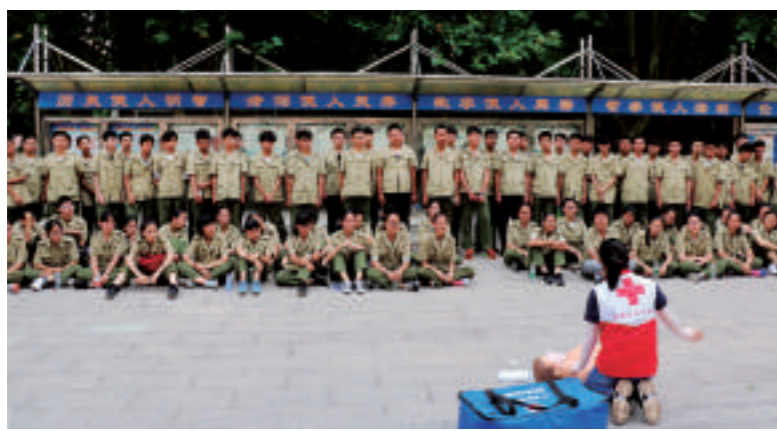
▲盐都红会为全区高一新生开展急救培训