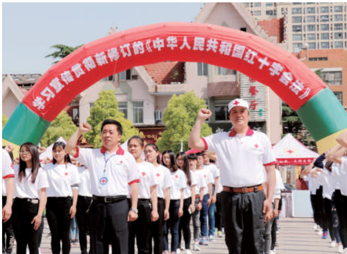
▲盐都工作人员向《中华人民共和国红十字会法》宣誓