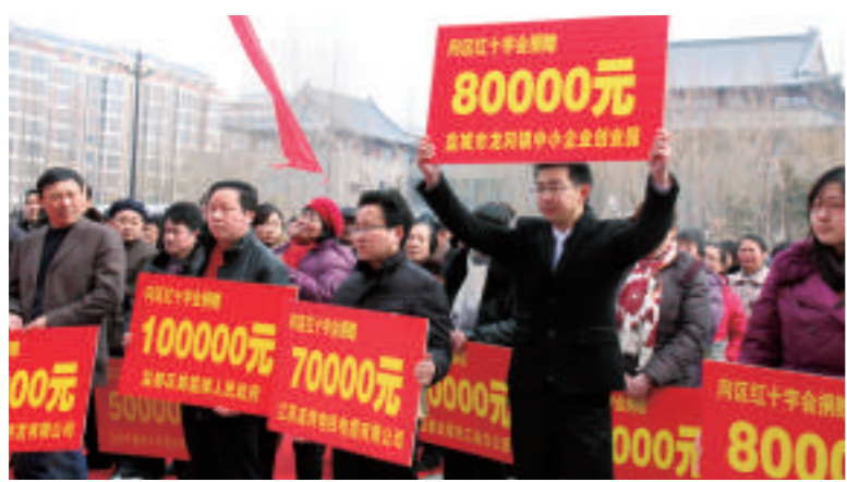
▲盐都各界踊跃支持红十字事业