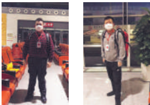
奔赴广西取运造血干细胞回吉林的两名志愿者。

疫情下,他们付出最大的爱、付出对生命最大的敬重,让生命与生命、真心与真心重叠在一起,力挽生命狂澜。