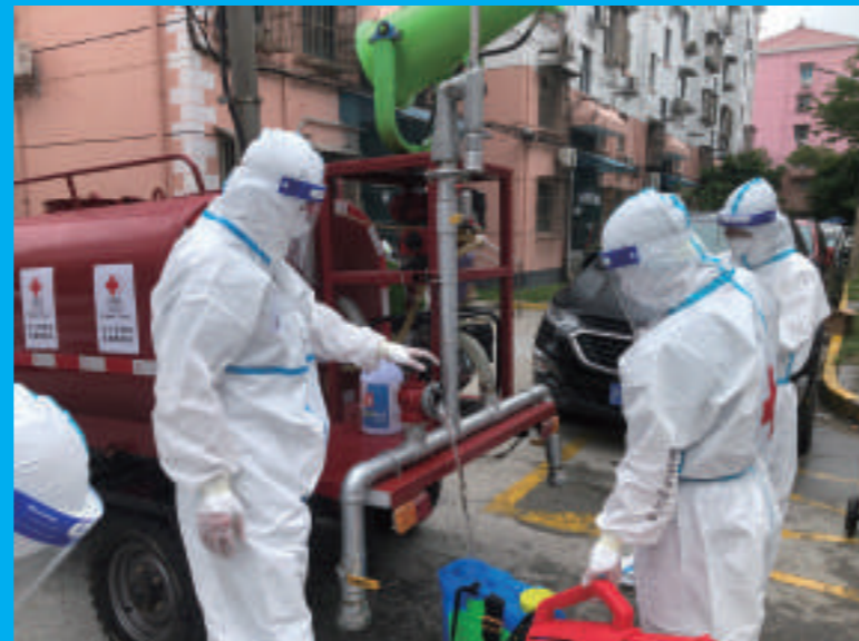
▲ 队员利用三轮车补充消毒水