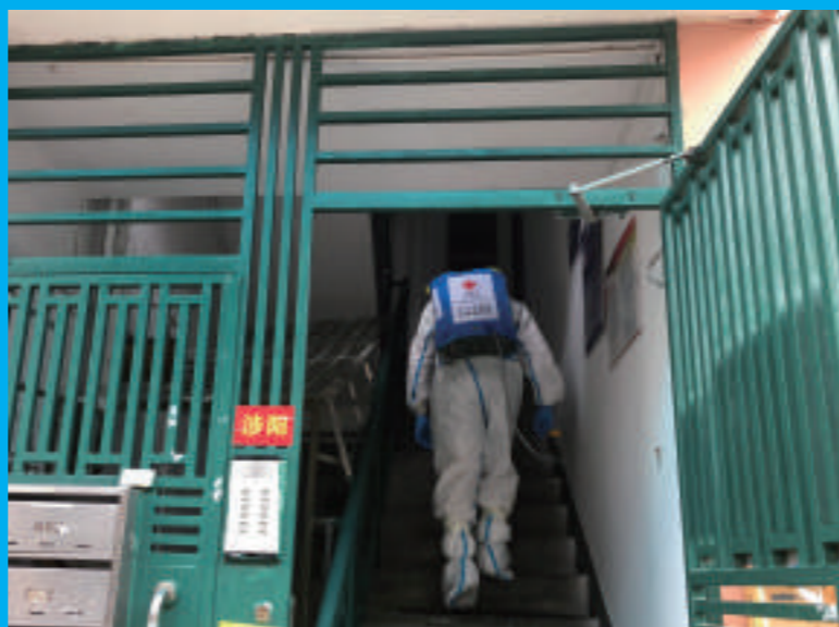
▲ 队员进入涉阳楼栋