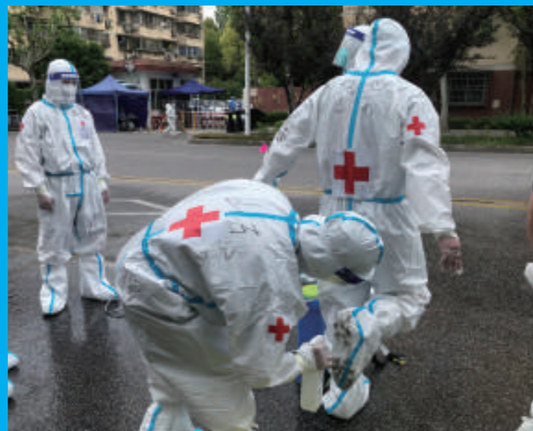
▲ 结束任务后，队员之间进行防护消杀