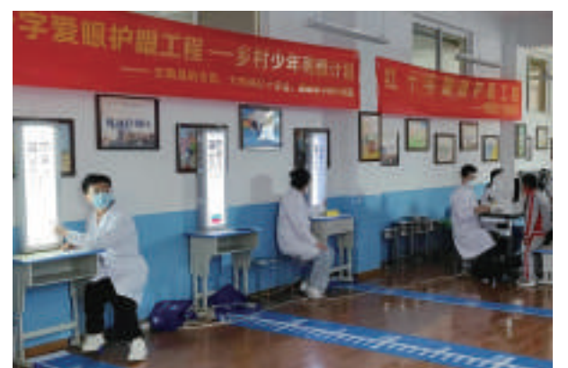
2022年3月,红十字爱眼护眼工程走进云南楚雄大姚县开展眼健康筛查活动