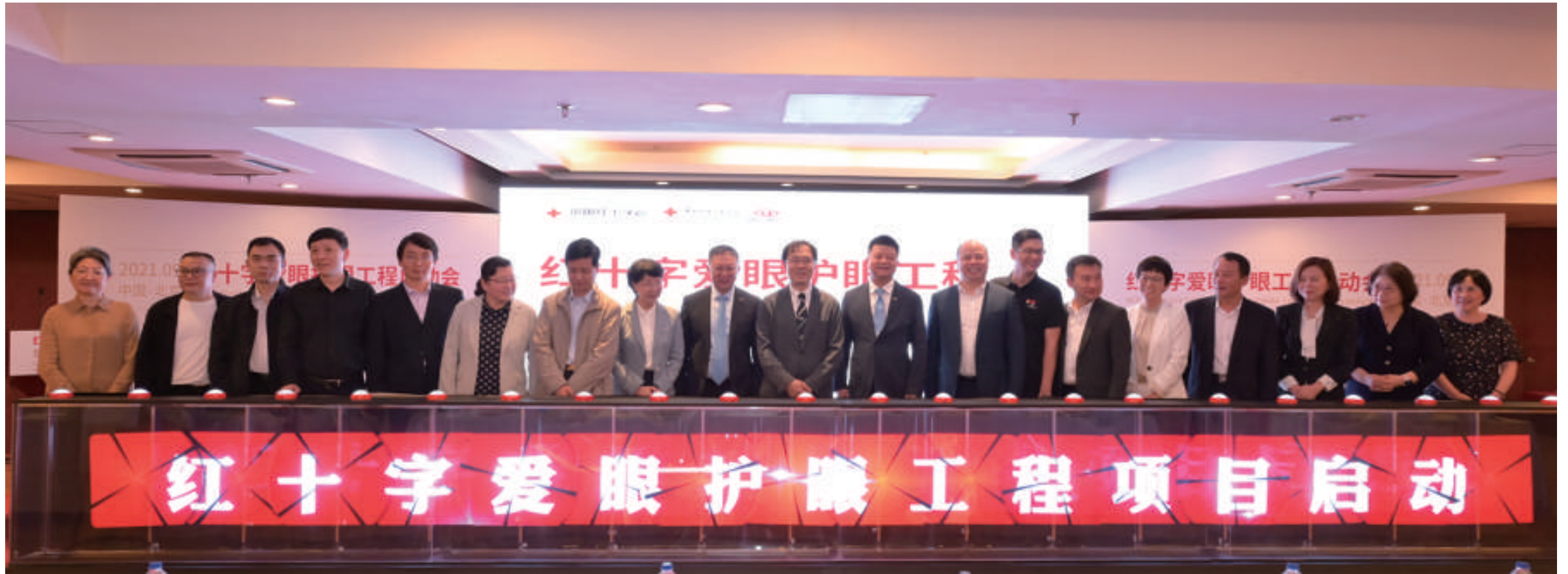
2021年9月,“红十字爱眼护眼工程”在北京启动