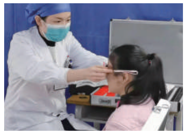
2022年2月,红十字爱眼护眼工程走进湖南湘西开展眼健康筛查活动