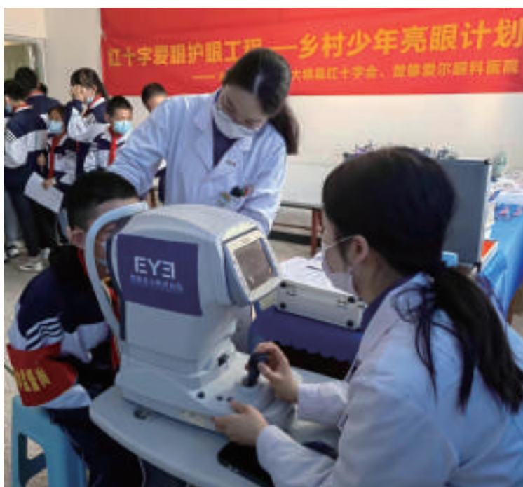
2022年3月,红十字爱眼护眼工程走进云南楚雄大姚县开展眼健康筛查活动