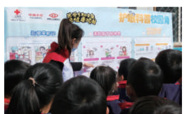
2022年5月,红十字爱眼护眼工程走进甘肃陇南开展眼健康筛查和科普宣教活动