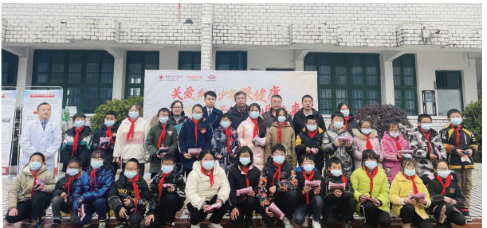
2022年1月,红十字爱眼护眼工程走进湖南湘西花垣县开展眼健康筛查和科普活动