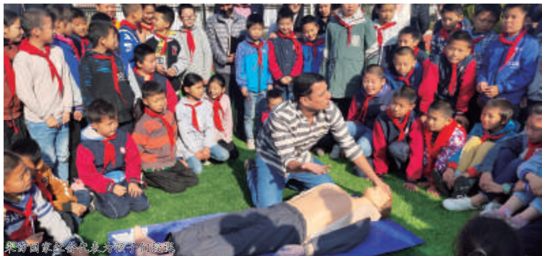
黄冈市红十字会为留守儿童提供