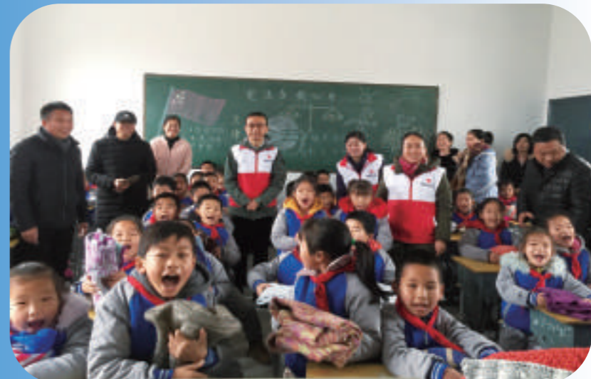
红十字会为小学生带去毛衣,送上温暖