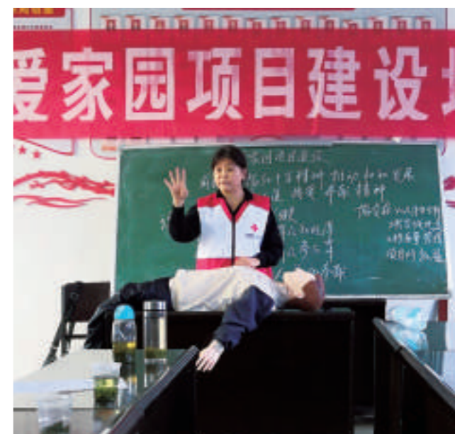
总会培训中心培训师在全县铺镇龙珠村开展博爱家园和急救救护专题培训