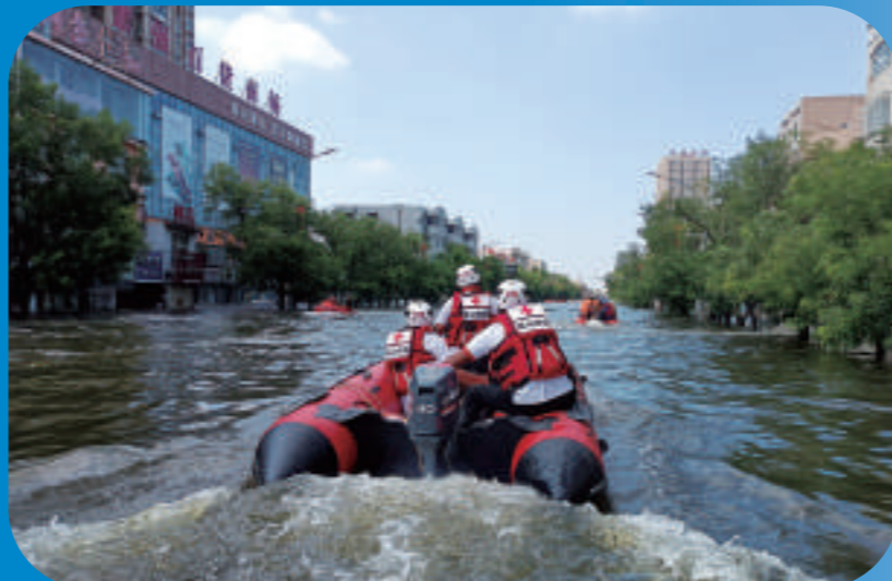
2021年7月20日,暴雨侵袭河南,英山县红十字会救援队赶赴河南救灾

自2015年底中国红十字会总会定点帮扶以来,湖北省黄冈市英山县红十字会事业发展开启了一段极不平凡的发展历程。在总会的倾情倾力帮扶下,在县委、县政府的坚强领导下,在各级红十字会的高度重视下,在社会各界的关心支持下,县红十字会以“人一之我十之、人十之我百之”的精神状态,牢记使命、感恩奋进,务实创新、敢为人先,成功打造县级红会“英山样板”,有效发挥了红十字会作为党和政府在人道领域的助手和联系群众的桥梁纽带作用。