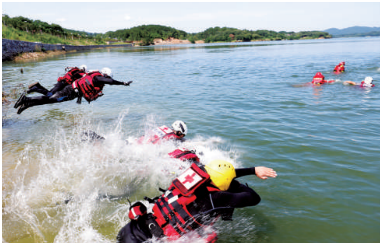
英山县红十字会救援队进行水上救援训练

督办、审计五大机制。通过实施博爱家园项目,累计支持新修、改、扩建农村公路39条,新建避灾广场28个,修复水毁石岸、河堤21处,修整水渠、水塘12口,新建、维修桥梁6座,其他防灾减灾、卫生健康工程32个,广大村民生产生活安全系数得以提高。累计发展茶叶基地22个、中药材基地17个、花卉苗木基地3个、帮扶车间4个、小额贷款及其他种植养殖项目30个,通过与产业有机结合,逐步实现农村自我“造血”能力。以博爱家园为抓手,基层群众广泛参与,在村“两委”换届中,红十字会项目村“两委”选举高票通过,创造了红十字工作与党建有机融合、有效促进基层治理的“英山模式”。